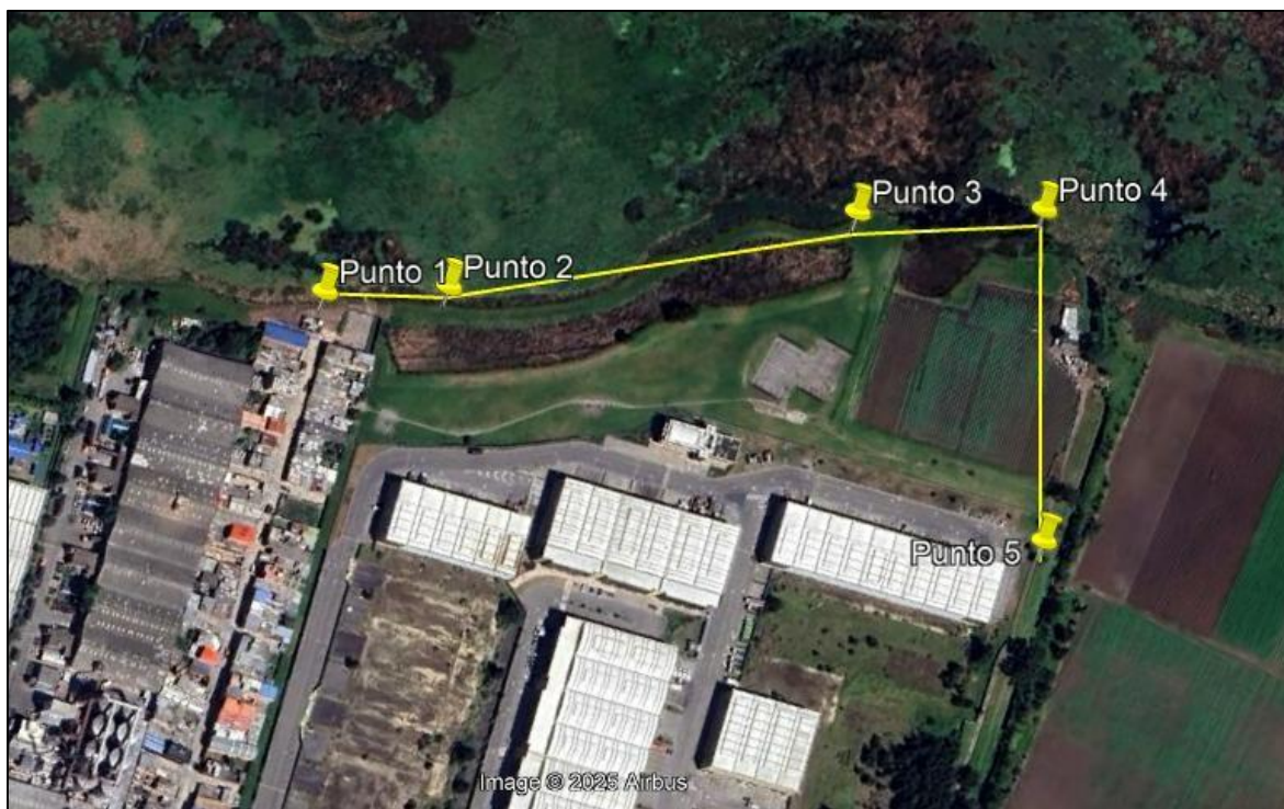
Ilustración 1. Recorrido de verificación ambiental-Ronda humedal Gualí.

Se realizó recorrido de control y vigilancia en la ronda del humedal Gualí, Barrio Francisco Martínez Rico, el día 29 de marzo de 2025, desde las coordenadas 4°42'10,512" N- 74°11'38,230" W, hasta las coordenadas 4°42'13,093" N- 74°11'24,337" W, (ver ilustración 1. Ruta amarilla), ecosistema que fue declarado por la Corporación Autónoma Regional de Cundinamarca - CAR como Distrito Regional de Manejo Integrado a través del acuerdo 001 de 2014 "Por medio del cual se declaran como Distrito Regional de Manejo Integrado (DMI), los terrenos comprendidos por los humedales de Gualí, Tres Esquinas y Lagunas de Funzhé, y su área de influencia directa ubicada en los municipios de Funza, Mosquera y Tenjo, Cundinamarca", y estableció tres zonas: 1. Preservación (espejo de agua), 2. Recuperación (50 metros) y 3. Uso sostenible (100 metros), con el fin de verificar las condiciones ambientales, identificar posibles afectaciones a los recursos naturales y realizar las acciones de prevención correspondientes.