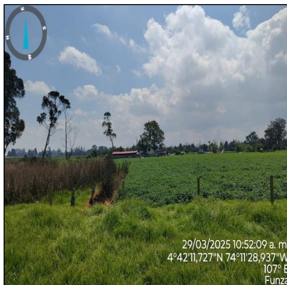
Ilustración 5. Actividades agrícolas.

Para el desarrollo de dicha actividad, el predio realiza riego de sus cultivos a través de una manguera, la cual se conecta a una motobomba con la que se realiza la captación de agua del canal “La Ramada” del sistema hidráulico de manejo ambiental y de control de inundaciones La Ramada.