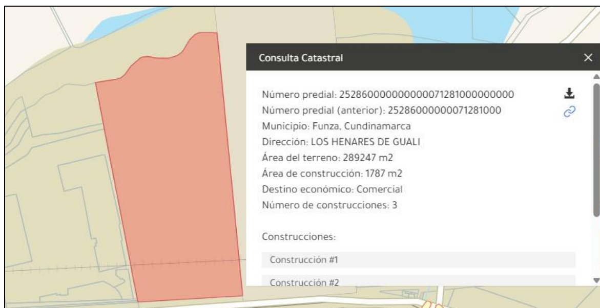
Ilustración 4. Consulta catastral

El predio “Los Henares de Gualí” se encuentra identificado con cedula catastral 252860000000000071281000000000, de conformidad con la consulta realizada en el geoportal del Instituto Geográfico Agustín Codazzi -IGAC.