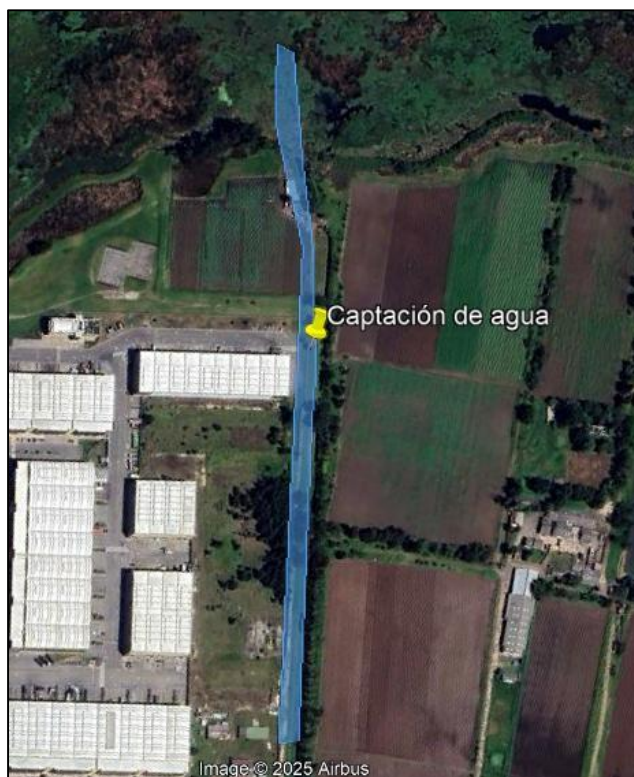
Ilustración 6. Canal La Ramada

Para el desarrollo de dicha actividad, el predio realiza riego de sus cultivos a través de una manguera, la cual se conecta a una motobomba con la que se realiza la captación de agua del canal “La Ramada” del sistema hidráulico de manejo ambiental y de control de inundaciones La Ramada.