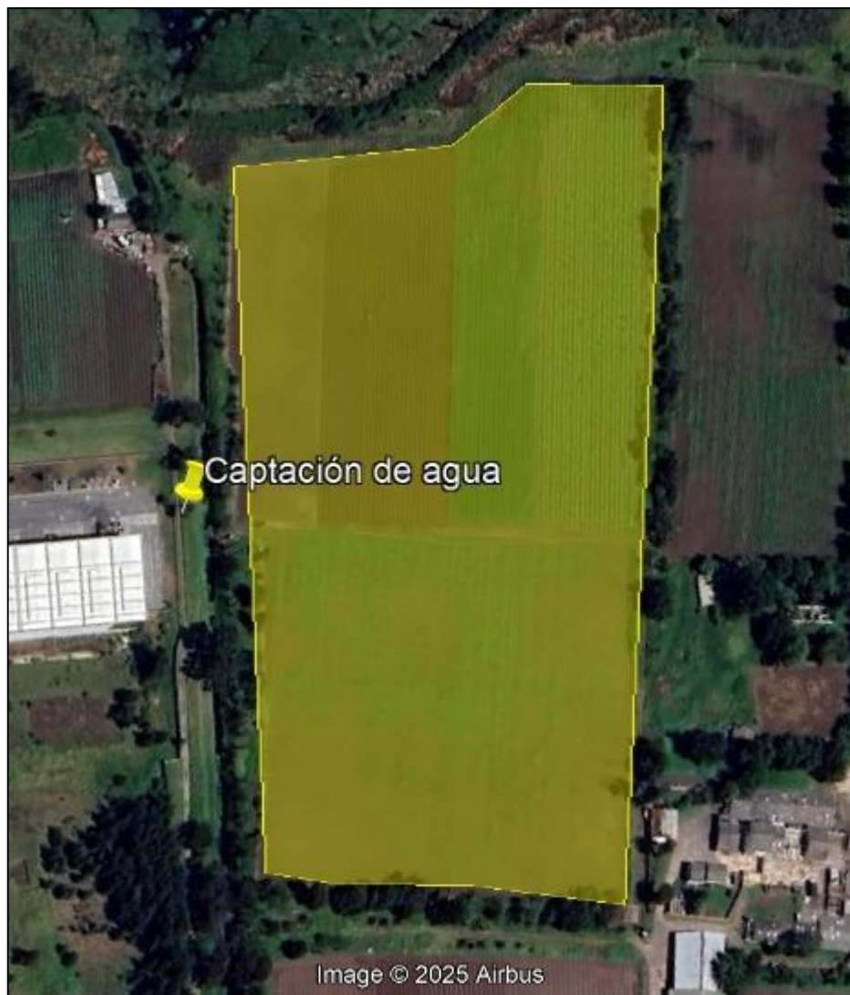
Ilustración 2. Ubicación del predio y captación superficial

Dentro del recorrido se identificó una captación de agua superficial en el predio denominado “Los Henares de Gualí” coordenadas 4°42’13,093” N- 74°11’24,337” W”, dicha captación se realiza del canal “La Ramada”, el cual hace parte del sistema hidráulico de manejo ambiental y de control de inundaciones La Ramada, sistema que fue establecido por la Corporación Autónoma Regional de Cundinamarca - CAR mediante el acuerdo 037 de 2014.